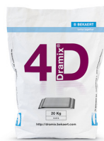
БУМАЖНЫЕ МЕШКИ 20 kg