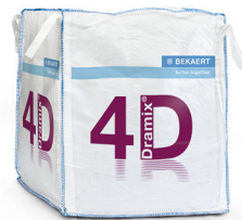
КРУПНОГАБАРИТНЫЕ 1.100 kg