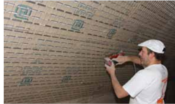
Snelle en eenvoudige plaatsing van Bekaert Stucanet ® op houten kepers.

Stucanet ® kan je zowel manueel als machinaal bepleisteren. Typisch wordt met een totale laagdikte van 20 mm gewerkt. Wij verwijzen naar de aanbeveling van pleisterfabrikanten voor meer specifieke aanbevelingen.