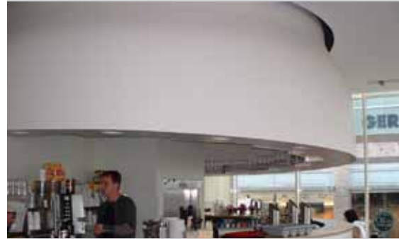
Cafebar, Wiesbaden, Duitsland