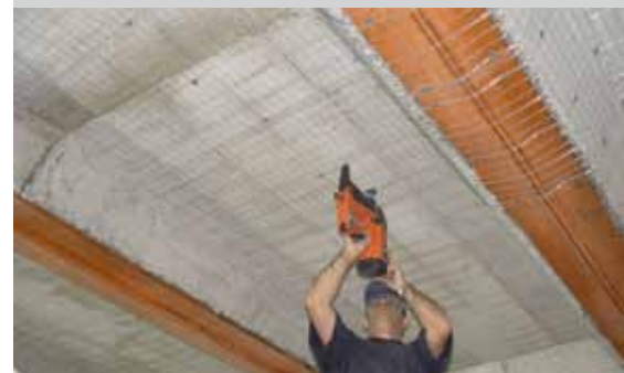
Montage van Bekaert Stucanet ® op een betonnen ondergrond.