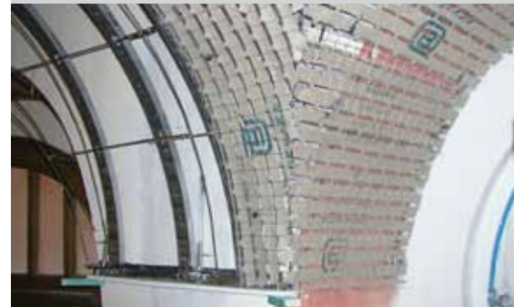
Bekaert Stucanet ® panelen zijn heel buigzaam, en kunnen gemakkelijk op metalen profielen worden aangebracht.