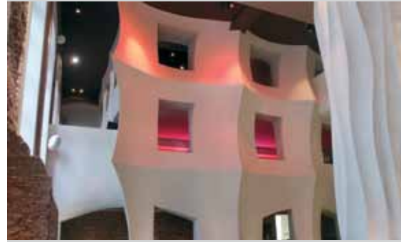
East-Hotel, Hamburg, Duitsland

Stucanet® maakt nieuwe architecturale en artistieke afwerking van zowel binnen- als buitenpleisterwerk mogelijk. Zowel in woningbouw als in niet-residentiële toepassingen (bijvoorbeeld restaurants, hotels) heeft de ontwerper of architect de vrijheid om een eigenzinnig ontwerp te realiseren. Ook voor de aanleg van recreatieparken bleek Stucanet® al meermaals de ideale oplossing om de meest fantasierijke creaties te bouwen.