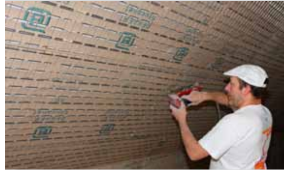
Placement rapide et simple de Bekaert Stucanet® sur des chevrons en bois.

Consultez les instructions du fabricant du plâtre pour des recommandations plus spécifiques.