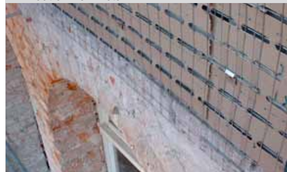
Panneaux Bekaert Stucanet ® utilisés dans un projet de rénovation de façades avec un plâtrage extérieur.