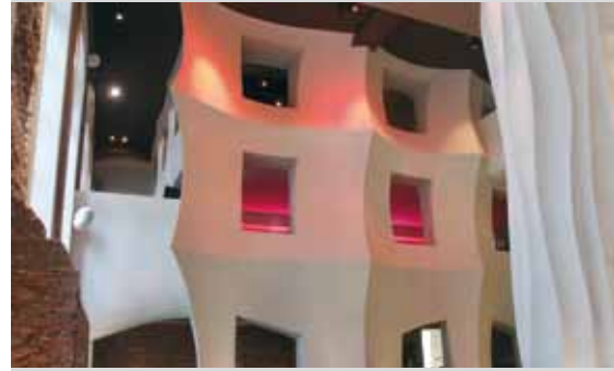
East-Hotel, Hamburg, Allemagne

Stucanet® autorise une nouvelle finition architecturale et artistique pour le plâtrage tant en intérieur qu'en extérieur. Le designer ou l'architecte ont toute liberté pour réaliser une conception originale aussi bien dans les habitations que dans les bâtiments non résidentiels (tels que des restaurants ou des hôtels). Dans l'aménagement de parcs de loisirs, Stucanet® constitue également la solution idéale pour imaginer les créations les plus fantaisistes.