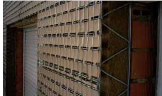
Panneaux Bekaert Stucanet ® comme support de mortier dans un système d'isolation de façades, montés sur des profils Bekaert Poutrafil ® en métal.