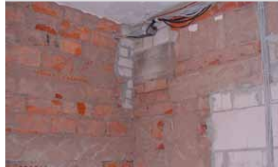
En cas de projets de rénovation, la base est souvent composée d'un mélange de différents matériaux de construction. Les panneaux Bekaert Stucanet ® permettent de rénover et de plâtrer d'une manière durable ce type de murs complexes.