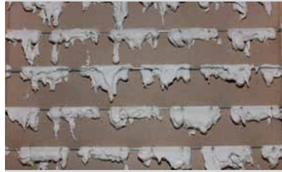
L'adhérence du plâtre autour des fils d'acier assure une fixation solide.

Ce faisant, cela offre une meilleure garantie contre les fissures et la réalisation de plafonds ou de travaux en extérieur.