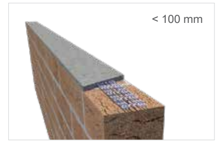
Murfor® Compact E-35