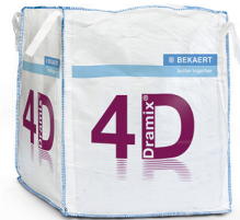
大袋 1.100 kg