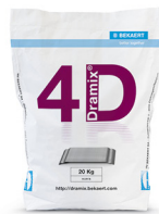
每袋 20 kg