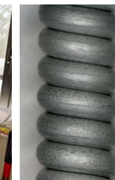
Dráty Bezinal® 80násobné zvětšení