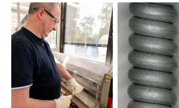
Bezinal®-Drähte 80fache Vergrößerung