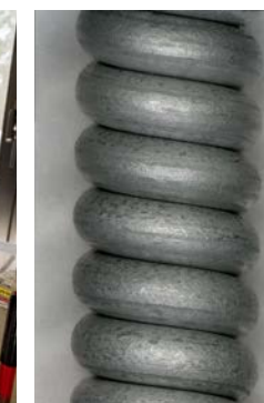
Fils Bezinal® Taux d'agrandissement de 80x