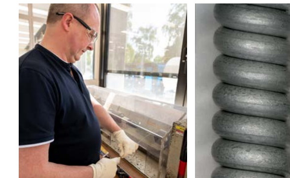
Bezinal®-draden Vergrotingsfactor 80x

Onze draden met Bezinal®-coating presteerden goed bij zoutsproeitests in ons Bekaert Technology Center en bij een vijf jaar durende bodemcorrosietest op een testsite bij OCAS NV. We stelden vast dat de Bezinal®-draden beter presteerden dan gewone verzinkte draden.