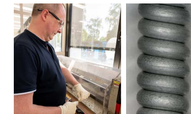
Bezinal® huzalok 80x-os nagyítási arány

Különböző feszítőhuzalainkat másodpercenként 1 fordulat sebességgel csavartuk saját átmérőjük körül. A két eredményt mikroszkóp alatt, 80x-os nagyítással összehasonlítva, a Bezinal® huzalainkról készült fényképeken lényegesen kevesebb repedés látható, mint a hagyományos huzalokon.