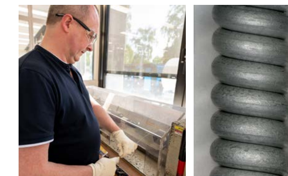
Fili Bezinal® Rapporto di ingrandimento 80x

I fili Bezinal® sono stati piegati e avvolti su se stessi intorno al proprio asse alla velocità di 1 giro/secondo senza che si verificassero problemi. I nostri fili Bezinal® sono stati poi analizzati al microscopio con un fattore di ingrandimento di 80x, e le foto mostrano una superficie liscia senza crepe.