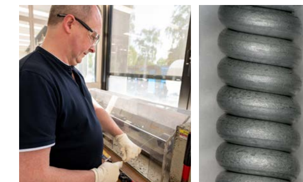
Druty Bezinal® Współczynnik powiększenia 80x

Utrzymanie gleby w dobrej kondycji ma kluczowe znaczenie dla zdrowego wzrostu owoców. Wybór konstrukcji odpornej na korozję jest kluczowe, aby zapobiec przedostawaniu się szkodliwych substancji do gleby. Priorytetowe traktowanie stanu gleby jest niezbędne dla uzyskania optymalnej wydajności winnicy. Nasze druty powlekane Bezinal® osiągnęły dobry wynik w testach mgły solnej w Centrum Technologicznym Bekaert oraz w 5-letnim badaniu wpływu gleby na korozję przeprowadzonym na zewnętrznym stanowisku testowym. Instytut OCAS NV potwierdził dużo lepszą wytrzymałość drutów na korozję w porównaniu z drutami ocynkowanymi.