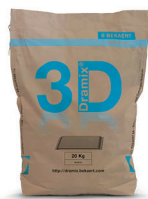
SACS 20 kg