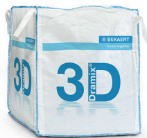
BIG BAG 800 - 1.100 kg