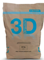
SACS 20 kg