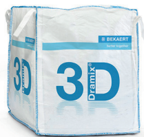
BIG BAG 800 - 1.100 kg