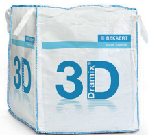
КРУПНОГАБАРИТНЫЕ 1.100 кг