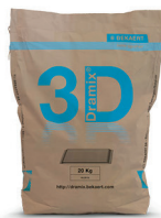
БУМАЖНЫЕ МЕШКИ 20 кг