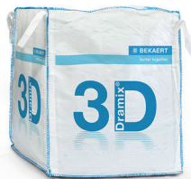
КРУПНОГАБАРИТНЫЕ 1.100 кг