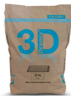
БУМАЖНЫЕ МЕШКИ 20 кг