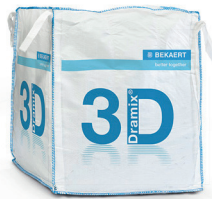
大袋 800 - 1,100 kg