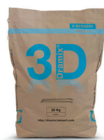
SACS 20 kg