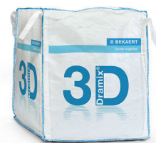
BIG BAG 800 - 1.100 kg