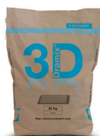
БУМАЖНЫЕ МЕШКИ 20 кг