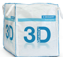
КРУПНОГАБАРИТНЫЕ 1.100 кг