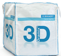
КРУПНОГАБАРИТНЫЕ 1.100 кг