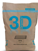
БУМАЖНЫЕ МЕШКИ 20 кг