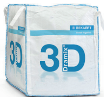
КРУПНОГАБАРИТНЫЕ 1.100 кг