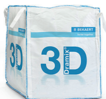
BIG BAG 800 - 1.100 kg