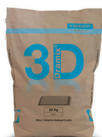
ZAKKEN 10 / 20 kg