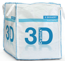
大袋 800 - 1,100 kg