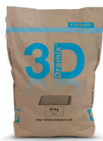
每袋 10 / 20 kg