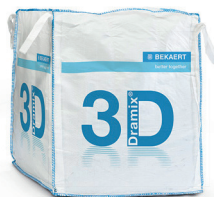
BIG BAG 800 - 1.100 kg