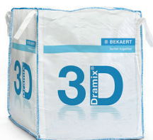
КРУПНОГАБАРИТНЫЕ 800 - 1.100 kg