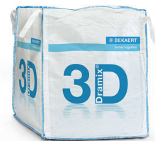
大袋 800 - 1,100 kg