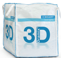
BIG BAG 1.100 kg