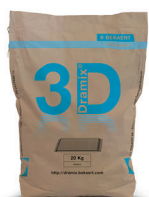
БУМАЖНЫЕ МЕШКИ 20 кг