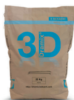
SACS 20 kg