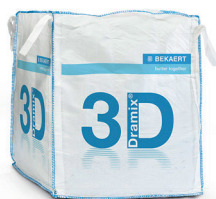
BIG BAG 800 - 1.100 kg