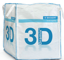
BIG BAG 800 - 1.100 kg