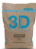
SACS 20 kg