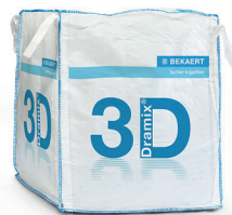
大袋 800 - 1,100 kg