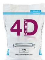
БУМАЖНЫЕ МЕШКИ 20 kg