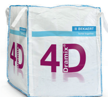
КРУПНОГАБАРИТНЫЕ 1.100 kg