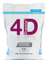
БУМАЖНЫЕ МЕШКИ 20 кг