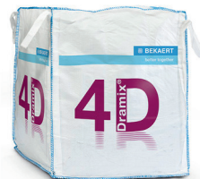
КРУПНОГАБАРИТНЫЕ 1.100 кг