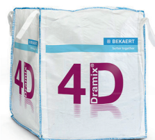
BIG BAG 1.100 kg