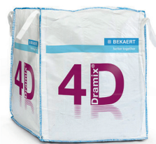
BIG BAG 800 - 1.100 kg