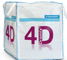
BIG BAG 800 - 1.100 kg