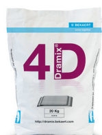
ZAKKEN 20 kg