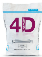
每袋 20 kg