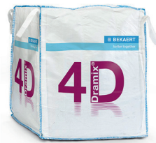
大袋 1,100 kg