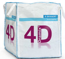
BIG BAG 800 - 1.100 kg