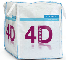
BIG BAG 800 - 1.100 kg