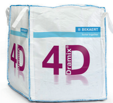
КРУПНОГАБАРИТНЫЕ 1.100 кг