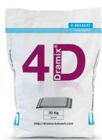
БУМАЖНЫЕ МЕШКИ 20 кг