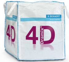
大袋 1,100 kg