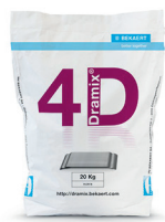
每袋 20 kg