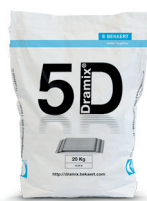
SACS 10 / 20 kg