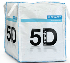
BIG BAG 800 - 1.100 kg